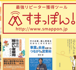
障害者雇用の実情を語った書籍を出版 ぶくおか経済、西日本新聞などメディアの取材多数