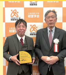
第12回日本でいちばん大切にしたい会社大賞を受賞しました!