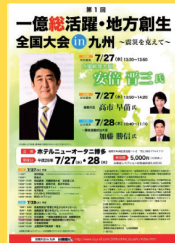
一億総活躍・地方創生全国大会でパネラーとして登壇